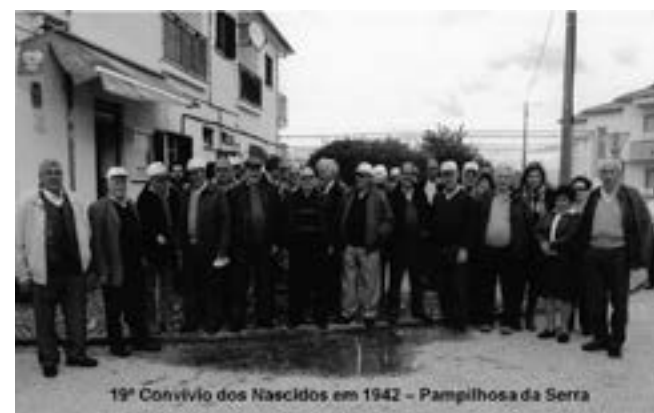
19º Convívio dos Nascidos em 1942 - Pampilhosa da Serra

Como nota final à que registar que, tal como nas edições anteriores se verificou uma grande proximidade